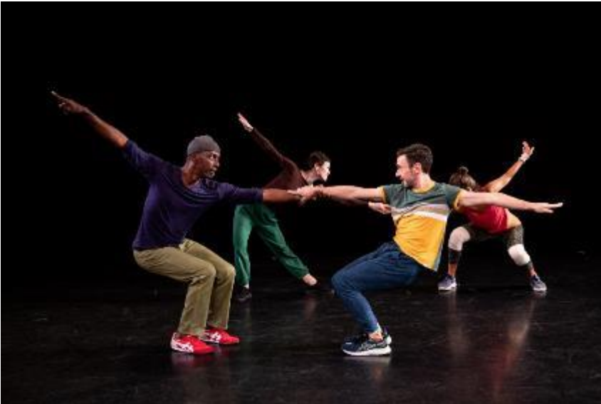
Yvonne Rainer, Hellzapoppin': What about the bees? .

Bitte beachten Sie: Bei der Verwendung sollten die Bilder nicht beschnitten werden und dürfen nicht mit Text überschrieben werden. Die jeweiligen Bildunterschriften sind verpflichtend. Bitte beachten Sie in jedem Fall das © der Abbildungen.